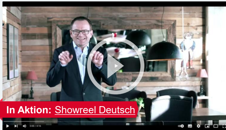
In Aktion: Showreel Deutsch